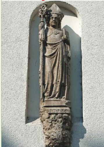
Św. Ottonie z Bambergu – módl się za nami!

Rzymskokatolicka Parafia p.w. Świętego Krzyża, Rok XIII, Nr 525 ; 30.06. – 03.08.2024 r.74-300 MYŚLIBÓRZ, ul. Kościelna 17, Tel.+48 534 179 127