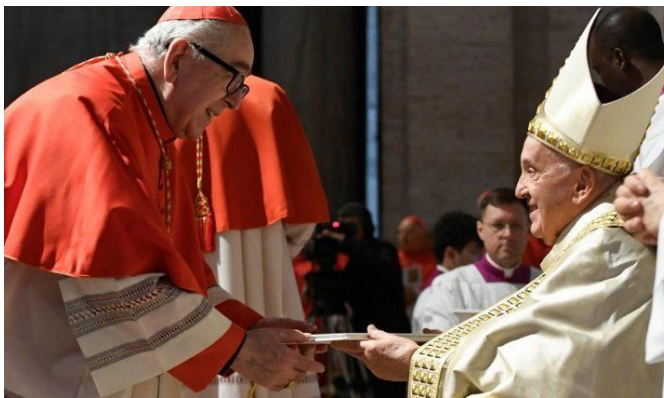
Bulla to najbardziej uroczysty spośród dokumentów papieskich.

W papieskiej bulli znajdują się praktyczne informacje m.in. o tym, że Jubileusz zainauguruje otwarcie Drzwi Świętych w bazylice watykańskiej 24 grudnia, a ich zamknięcie odbędzie się 6 stycznia 2026 roku. Natomiast w diecezjach nie przewiduje się otwierania Drzwi Świętych. Rok Jubileuszowy otworzy Eucharystia sprawowana we wszystkich katedrach i konkatedrach na świecie 29 grudnia. Papież podkreśla, że w „Kościołach partykularnych należy zwrócić szczególną uwagę na przygotowanie kapłanów i wiernych do spowiedzi oraz na dostępność tego sakramentu w formie indywidualnej”. Franciszek kieruje też specjalne zaproszenie do udziału w Jubileuszu do wiernych Kościołów Wschodnich, którzy, jak podkreśla, za swą wierność Chrystusowi wiele wycierpieli, często aż po śmierć.